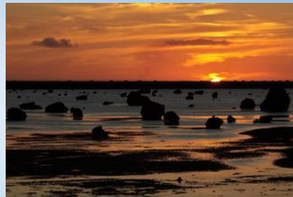
(宮古島：イメージ 山本学先生提供)